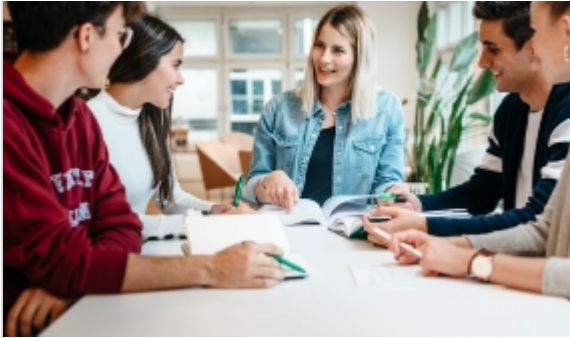
Entrepreneurial Eco-Day / Capstone «Unternehmerische Informatik»

Am 9. April tunen wir mit unseren Studierenden den Entrepreneurial Eco-Day zusammen mit Startup@HSG und STARTFELD durch. Wir besuchen verschiedene Co-Working Spaces sowie mehrere erfolgreiche Start-ups. Darunter das von ehemaligen HSG-Doktoranden gegründete onlinedoctor.ch und die von HSG-Doktoranden mitgegründeten Kaspar& und Frontify .