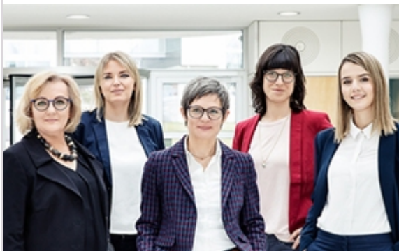
Das Weiterbildungsteam des KMU-HSG: Frauenpower!

In der Corona-Lockdown-Zeit haben wir gelernt, dass man Weiterbildung auch online durchführen kann. Obwohl das ganz gut gelungen ist, ist es schon nicht dasselbe wie Präsenzveranstaltungen.