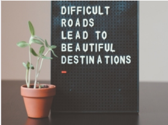
HRM in Coronazeiten

Welche neuen Herausforderungen müssen Unternehmen auf dem Radar haben, welche neuen Lösungen sollen sie umsetzen, um ihre MitarbeiterInnen in ihrer Flexibilität und Anpassungsfähigkeit an Veränderungen sowie in ihrem Wohlbefinden zu (be)stärken?