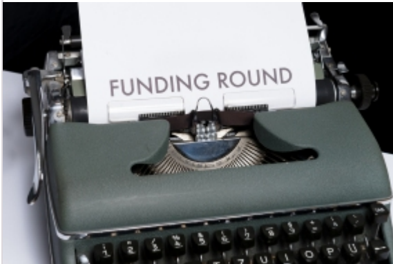
Schreibarbeit für Drittmittelfinanzierte BWL-Forschung

Die Drittmittelfinanzierung akademischer Forschung hat in Umfang und Wirkung rasch zugenommen. Damit stellen sich zentrale Fragen: