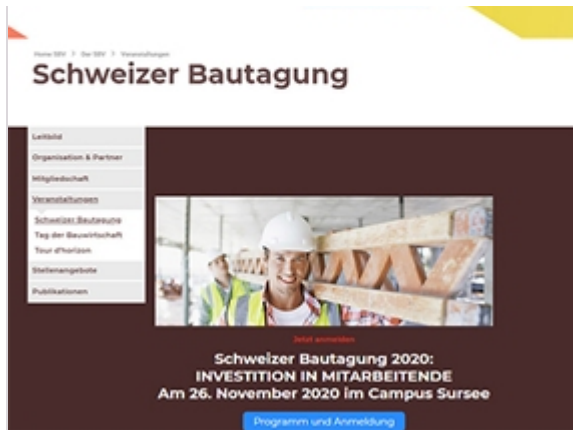
VR-Symposium, KMU-Tag und Schweizer Bautagung

aktuellen Arbeitsmarktes rund um Themen wie Arbeitgeberattraktivität und Aus- und Weiterbildung werden behandelt. Durch Expertenvorträge und den informellen Austausch unter Branchenkollegen erhalten Führungskräfte praxisnahe Einblicke, wie die richtigen Investitionen in die Belegschaft einen Wettbewerbsvorteil am Markt erzielen können.